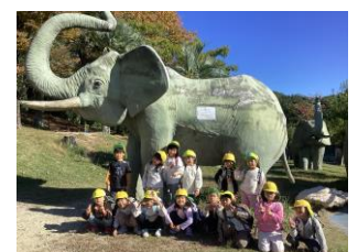
(モリコロパークで楽しむ園児たち)