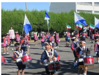
(鼓笛隊演奏の様子)

本日の幼年消防クラブの活動を通じて、火災に対して改めて園児達が認識してくれるようになってくれることを願っています。