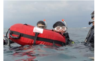
(マリンスポーツを楽しむ生徒)

沖縄では、1日目は「ひめゆりの塔」や「平和の礎」などで平和学習に取り組み、サンセットがきれいなウミカジテラスやエイサーショーと沖縄の歌などに触れ、沖縄文化に親しむことができました。そして、2日目はスポーツコースはスキューバダイビング、フードクリエイティブコースはサーターアンドギーづくりなどに取り組みました。3日目は「美ら海水族館」に行き、午後からマリンスポーツを楽しみました。