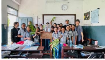
(ネパールでの環境学習支援)

また、高田中・高等学校では、学校生活のカーボンニュートラルを探究する「ゼロカーボンスクール」の紹介動画を作成しており、その動画が優良事例として、環境省の「環境教育・ESD実践動画100選」にも認定されました。