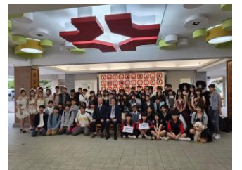
(育達高級中等学校で記念撮影)

その後、育達高級中等学校のコースが企画された講座を1時間ほど体験し、台湾の学校における食文化について学びました。最後に「千と千尋の神隠し」のモチーフになった「十份」と「九份」を観光しました。3日目は兵隊さんの荘厳な儀式を参観した後、「国立故宮博物館」を見学し、必見の至宝である翡翠白菜、角煮や陶器・磁器などを鑑賞しました。