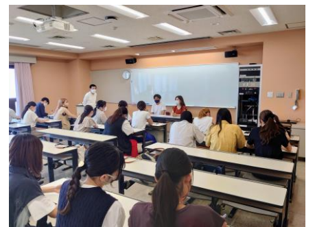
(新郎新婦様と初顔合わせ)

担当するブライダルビジネス科2年生が先日、初顔合わせで新郎新婦様と対面しました。新郎新婦様からお二人の性格や馴れ初めなどのお話をお伺いし、学生らがご希望の結婚式スタイルやお衣裳などの質問を投げかけては熱心にメモしていました。