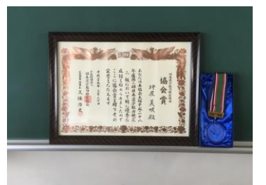
(坪屋さんに贈られた表彰状とメダル)