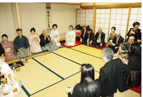
(茶道部でお点前を楽しむ)